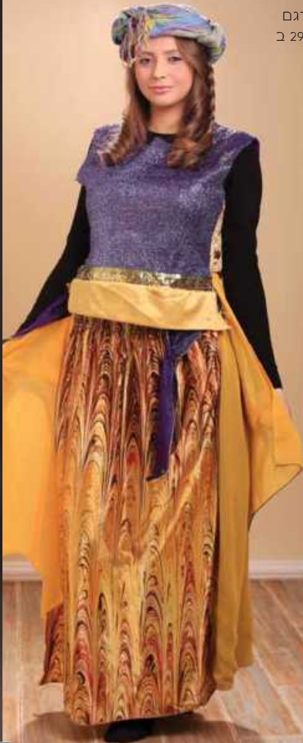
דגם ב 292