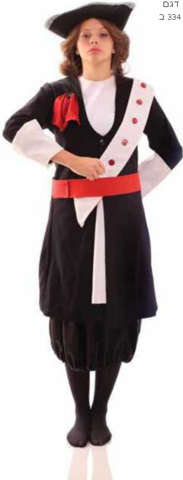
דגם ב 334