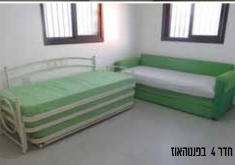
חדר 4 בפנתהאוז